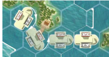
Coût des rotations